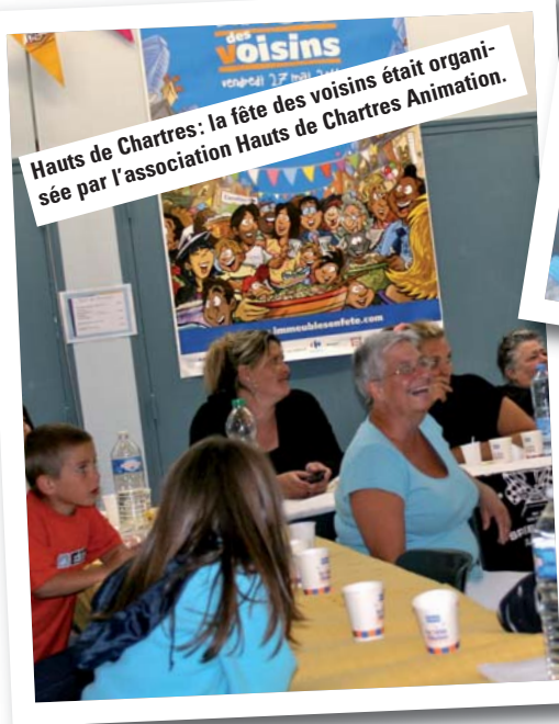
Hauts de Chartres : la fête des voisins était organisée par l'association Hauts de Chartres Animation.