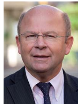
Jean-Pierre Gorges Président de Chartres Habitat Député-Maire de Chartres

A la veille des vacances, vous pouvez constater que Chartres Habitat est toujours en mouvement, et reste fidèle à ses principes d'action.