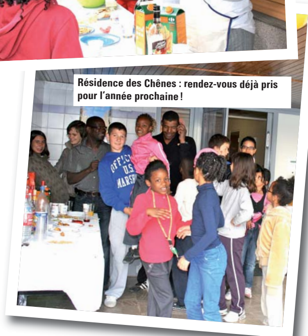
Résidence des Chênes : rendez-vous déjà pris pour l'année prochaine !