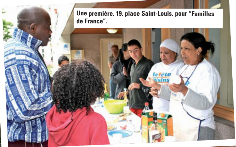
Une première, 19, place Saint-Louis, pour "Familles de France".