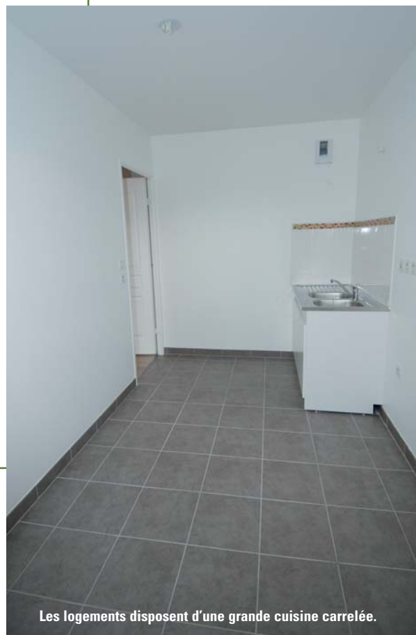
Les logements disposent d'une grande cuisine carrelée.