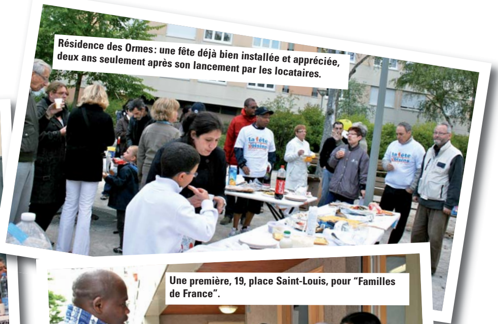
Résidence des Ormes : une fête déjà bien installée et appréciée, deux ans seulement après son lancement par les locataires.

Vendredi 27 mai, avait lieu, partout en France et même en Europe, la 11 e édition de la Fête des voisins. Malgré la fraîcheur ce soir-là, les habitants ont démontré qu'ils apprécient ce rendez-vous annuel, devenu pour certains un rituel.