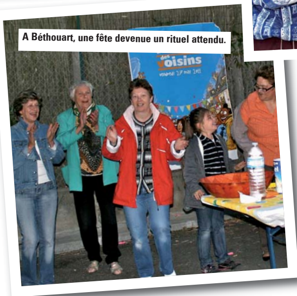
A Béthouart, une fête devenue un rituel attendu.