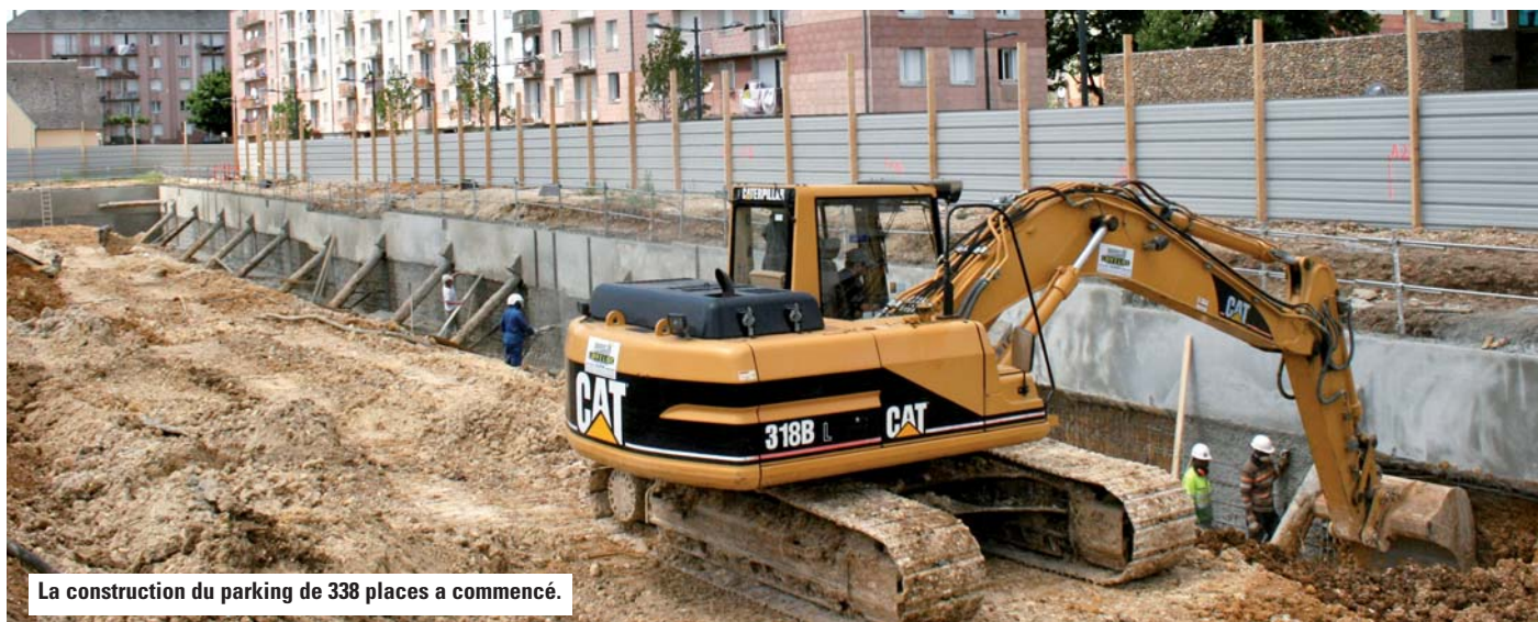
La construction du parking de 338 places a commencé.

Dans le souci d'améliorer ce dispositif, les membres de la Maison des Entreprises et de l'Emploi de l'Agglomération (coordinatrice du dispositif) ont décidé d'étendre la mise en œuvre de cette convention à tous les marchés publics du secteur du bâtiment de l'agglomération.