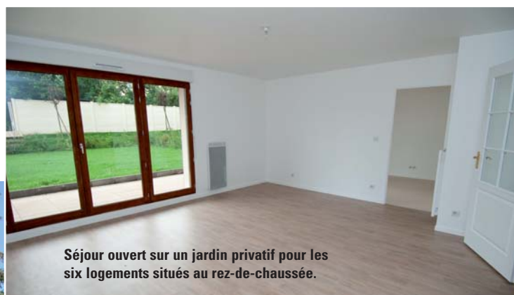
Séjour ouvert sur un jardin privatif pour les six logements situés au rez-de-chaussée.

Poutrelles métalliques et coursives extérieures desservant chaque logement caractérisent ce bâtiment. Le choix des matériaux permet de conjuguer la chaleur des briques et des boiseries, au métal et à l'acier.